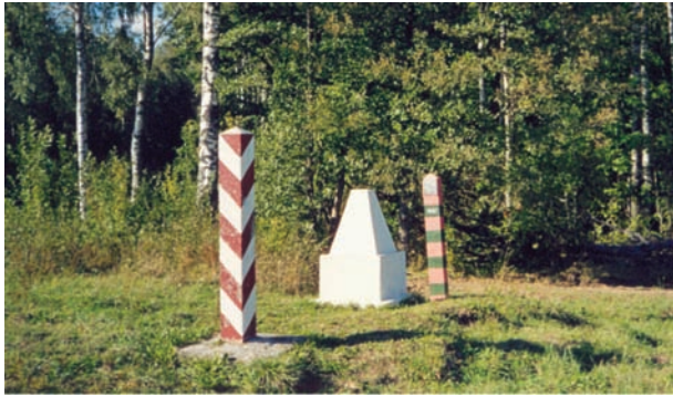
4 pav. Lenkijos Respublikos ir Sovietų Sąjungos valstybių sienos ženklas