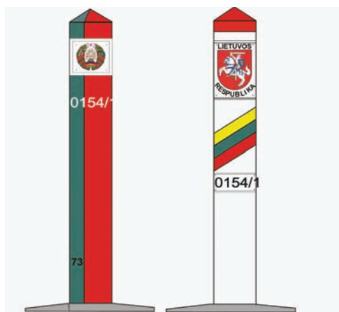
2 pav. Tarpinis valstybės sienos ženklas Fig. 2. Intermediate state border mark

Nustačius valstybės sienos atkarpas, kur buvo pažeista ši sąlyga, pastatyta tarpinių sienos ženklų (2 pav.). Jie buvo įrengiami sienos linijoje, t. y. tiesėje, jungiančioje gretimų sienos ženklų centrinius stulpelius, vietose, kur vietovės reljefas netrukdytų geriausiai matyti gretimų sienos ženklų.