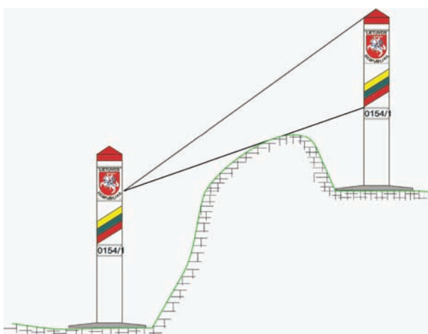
1 pav. Tiesioginis matomumas tarp gretimų sienos ženklų Fig. 1. Concept of the direct visibility lines between the adjacent boundary marks

Paženklinus valstybės sieną laikiniais sienos ženklais, pastebėta tiesioginio matomumo problema, tad Mišri demarkacijos komisija priėmė nutarimą dėl tiesioginio matomumo sampratos: tiesioginis matomumas tarp gretimų pagrindinių (sausumos ruožų) ir pereinamųjų iš sausumos į vandenį sienos ženklų – tai galimybė iš 160 cm (prietaiso aukščio) matyti gretimą Lietuvos pusės stulpą visas vėliavos spalvas. Vėliau ši sąvoka buvo patikslinta: tai galimybė iš 160 cm (prietaiso aukščio) matyti gretimą stulpą ne mažiau kaip per 56 cm nuo jo viršaus (1 pav.).