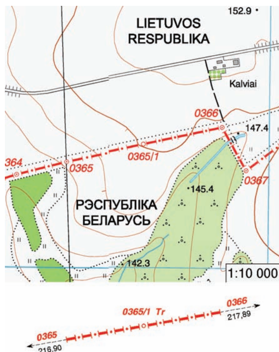
3 pav. Tarpinio sienos ženklų pavaizdavimo sienos žemėlapyje ir sienos ženklų protokole pavyzdys

Tarpinis sienos ženklas – tai vienas stulpas, kurio konstrukcija atitinka pagrindinio sienos ženklų stulpą, tačiau plokštumas į Lietuvos ir Baltarusijos teritorijas turėjo vėliavos kitos valstybinę atributiką: į Lietuvos pusę – Baltarusijos atributiką, į Baltarusijos pusę – Lietuvos atributiką. Šie sienos ženklai nebuvo koordinuojami, sienos ženklų protokoluose ir sienos žemėlapyje jie buvo vaizduojami skirtingu sutartiniu ženklu (3 pav.).