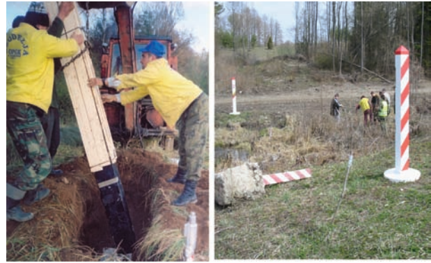
5 pav. Vyksta sienos ženklų keitimo darbai